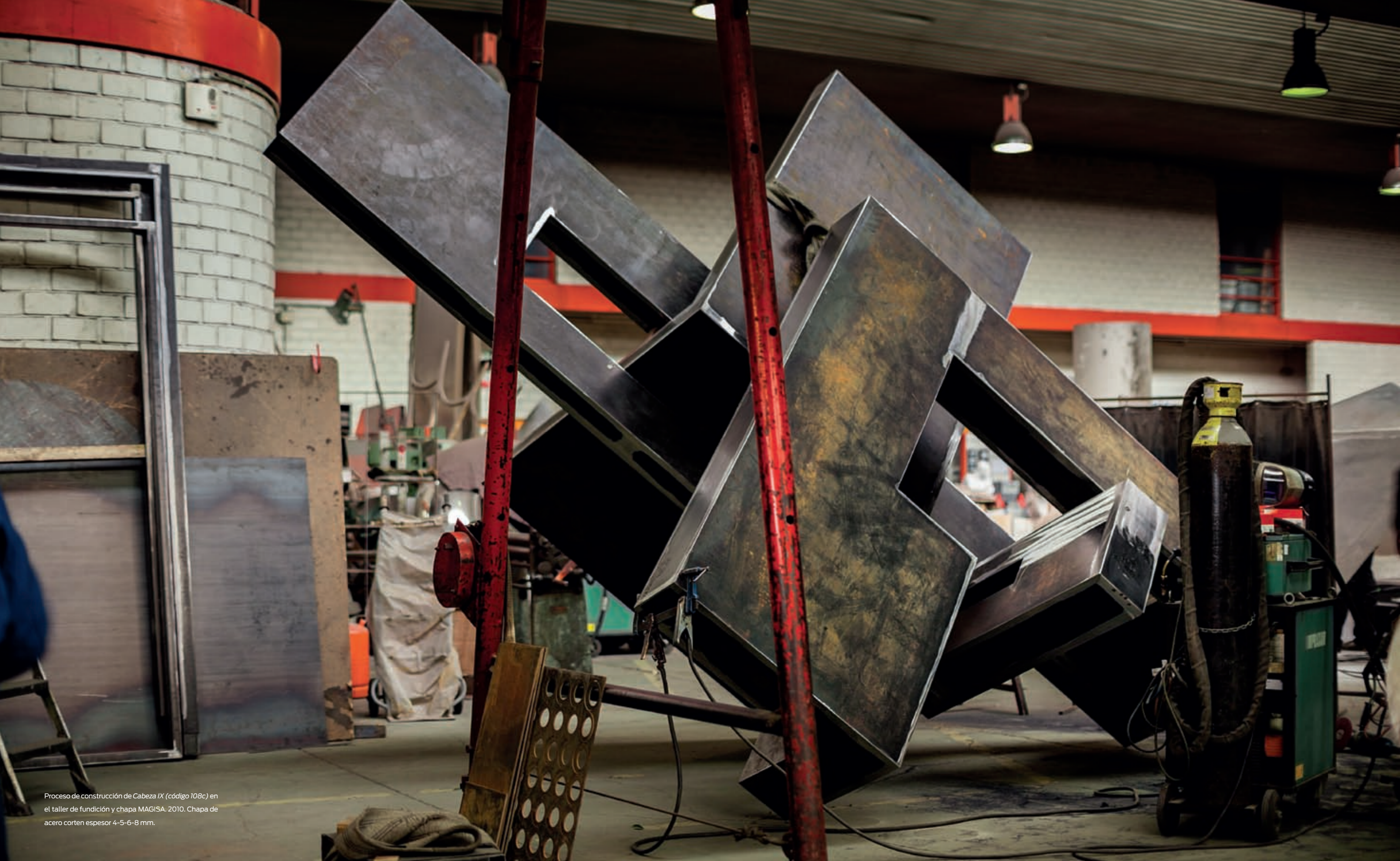
Proceso de construcción de Cabeza IX (código 108c) en el taller de fundición y chapa MAGISA, 2010. Chapa de acero corten espesor 4-5-6-8 mm.