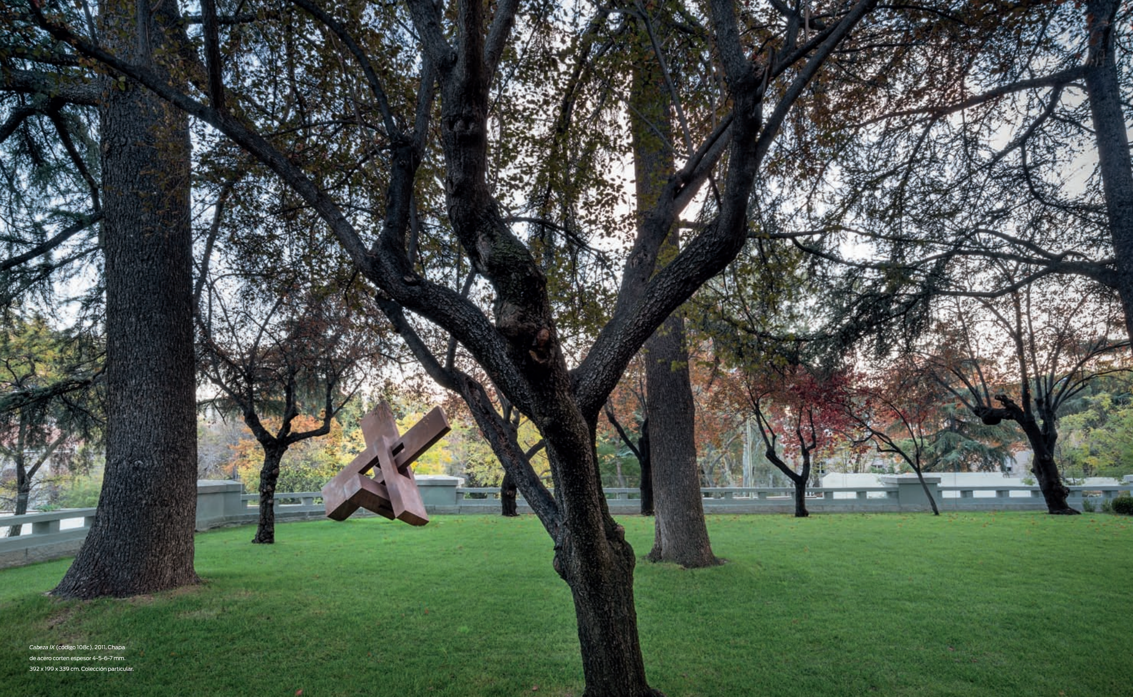
Cabeza IX (código 108c), 2011. Chapa de acero corten espesor 4-5-6-7 mm. 392 x 199 x 339 cm. Colección particular.